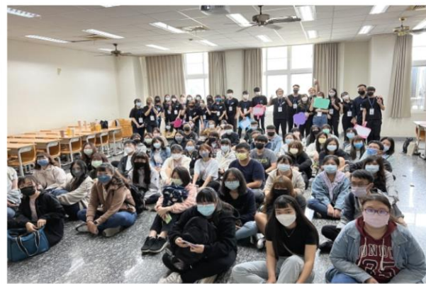
期初社員大會大合照