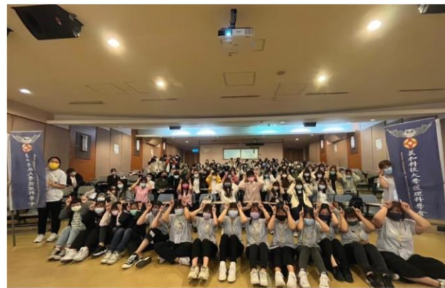
博采眾長·文采風流』名人演講