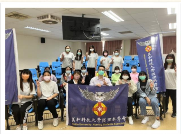
班代期初座談會大合照