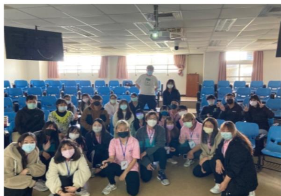
期初座談會大合照