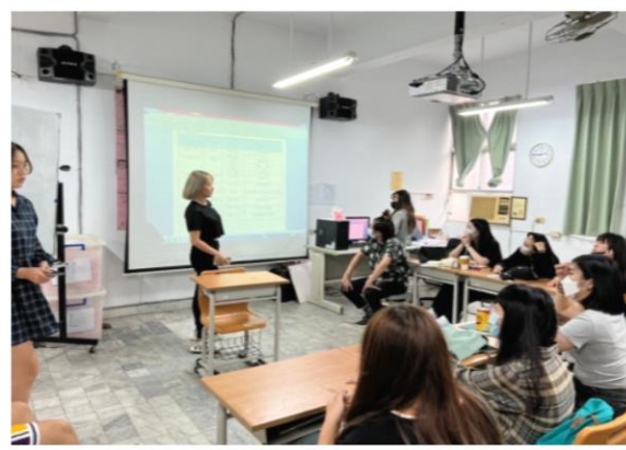
期初社員大會開會