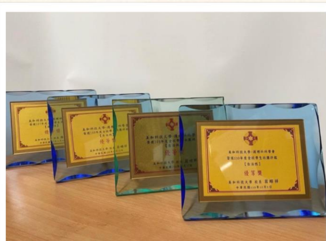
護理科學會榮獲校園評鑑自治性社團 「優等獎」

每學年度的評鑑對於科學會的幹部來說是相當重要的。透過評鑑的成績，可以讓我們知道努力的方向是否有誤。因此，我們準備了許多的資料，再加上需要把資料電子化的關係，所以硬深深的又把難度提升了一個層次！而努力終將有回報，科學會今年評鑑取得的成績為「優等獎」，真是令所有人非常開心！