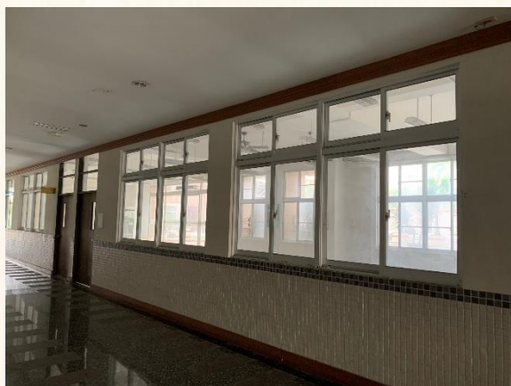
銀髮賦能人才培育基地預定地