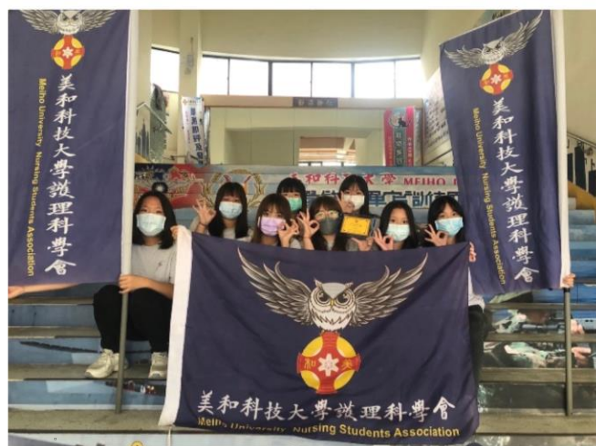
110級護理科學會全體幹部大合照

時光匆匆，在這一年的時間內，護理科學會舉辦了各式各樣的活動，不論是康樂性質的活動還是服務性質的活動，都讓我們從中學習到了如何讓一場活動誕生。