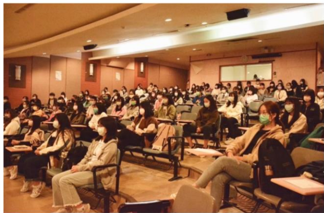
『博采眾長·文采風流』名人演講